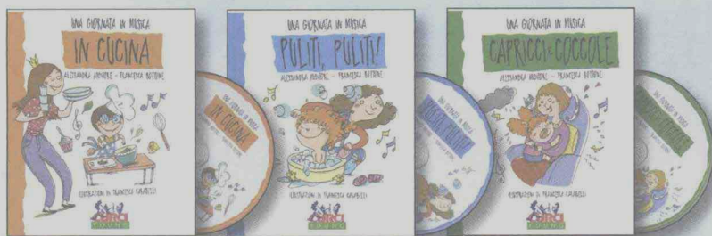
IN CUCINA EC 11973 (da)

Filastrocche, giochi, canti e attività per ogni momento con il tuo bambino. Con CD di Alessandra AUDITORE, Francesca BOTTONE. Illustrazioni di Francesca CARABELLI Età: 0-5 anni