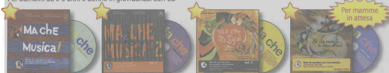
Illustrazioni di Alexandra Dufey MA CHE MUSICA! VOLUME 1. Con CD EC 11585 (il)

Brani di classica e jazz da ascoltare e da guardare, scelti secondo i criteri della Music Learning Theory di Edwin E. Gordon. Per bambini da 0-5 anni e donne in gravidanza. Con CD